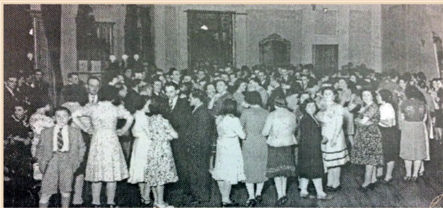
SALÓN DEL CLUB SOCIAL DE MOQUEHUÁ EN 1944