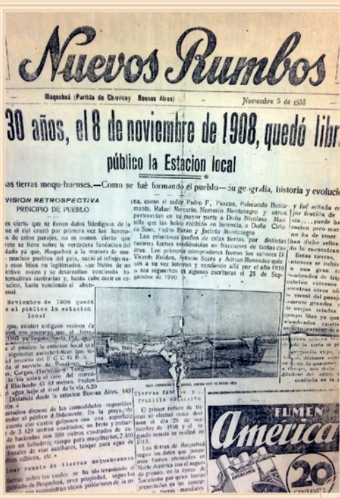
CASA DE LA CULTURA

FUNDADOR Y DIRECTOR DEL PERIÓDICO NUEVOS RUMBOS