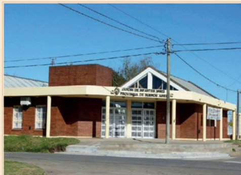
JARDÍN DE INFANTES N°903