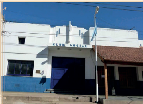
ESCUELA N°27 JUAN B. ALBERDI CLUB SOCIAL Y DEPORTIVO MOQUEHUÁ