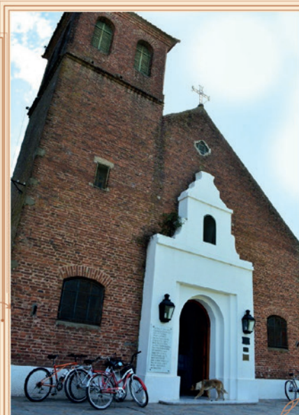
PARROQUIA SAN JOSÉ